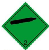
2.2 : Gases no inflamables, no tóxicos